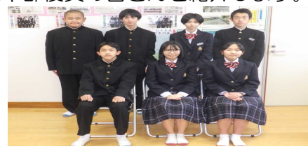
第41代生徒会本部役員の皆さん