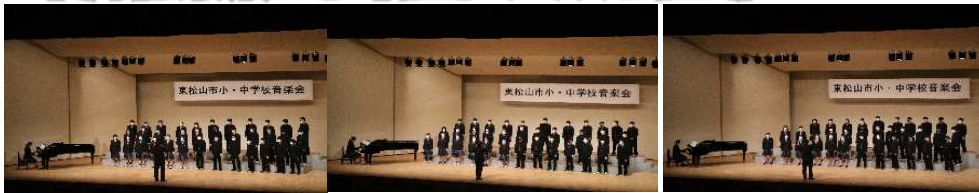
3年1組の合唱の様子