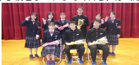
退任した第40代生徒会本部役員の皆さん