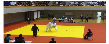
川野選手の試合の様子