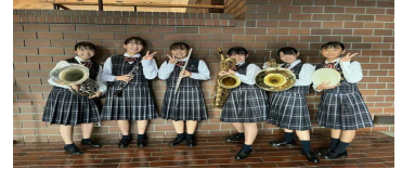
コンテスト後のメンバー