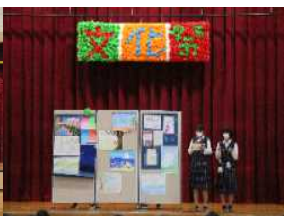
美術部の作品発表