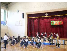
オープニングを飾る吹奏楽部