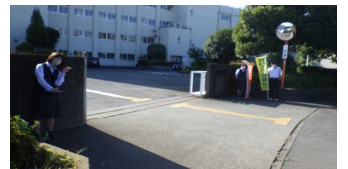
挨拶運動を頑張る生徒会