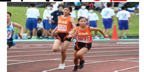
女子400mリレーの様子