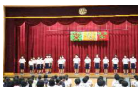
体育委員会の発表