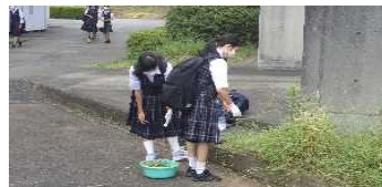
朝から除草を頑張る生徒

A君とB君が大野先生から理科室掃除を頼まれました。「ほうき掃き」と「床の水拭き」をするように指示が出ました。あなたなら、どんな会話を作業を分担するか考えてください。校長室まで教えに来てください。