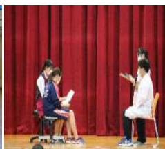
保健委員会の発表