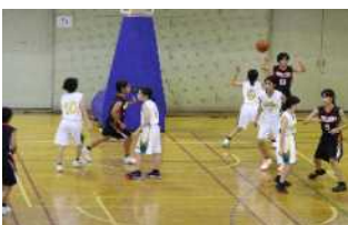
女子バスケット部