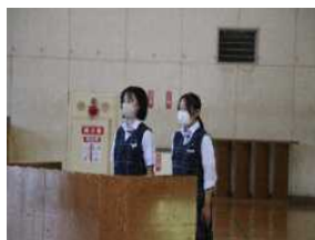
司会の合図で開幕