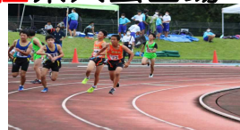
男子400mリレーの様子